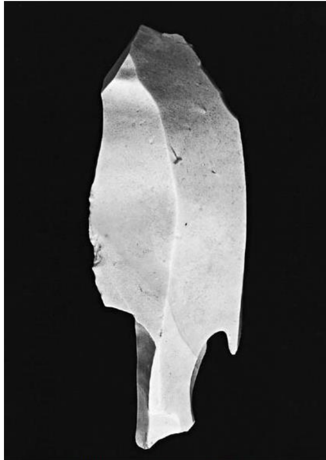
Několikanásobné hranové rydlo z Kelče.