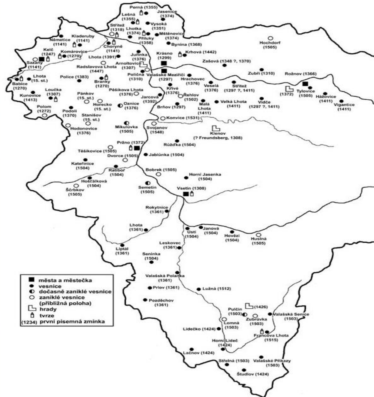
Struktura osídlení horního Pobečví do poloviny 16. století. Kresba D. Janiš